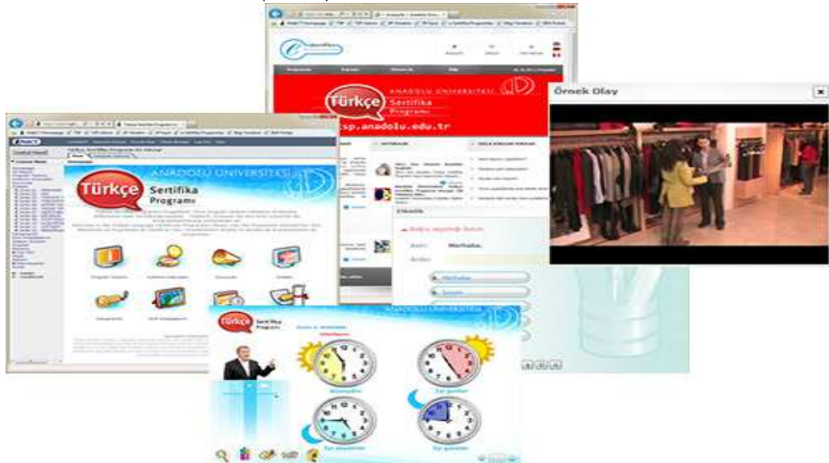
Resim 1: Türkçe Sertifika Programı Web Sitesi ve Portalı

Türkçe Sertifika Programı ile Türkçe'nin Avrupa'da ve tüm dünyada anadil ve ikinci dil olarak öğretilmesi hedeflenmektedir. Programda; Türkçe öğrenmek isteyen kişilere başlangıç düzeyinde ve günlük yaşamda ihtiyaç duyulan kapsamda Türkçe ikinci dil becerilerini kazandırmak ve Avrupa'da yaşayan ikinci ve üçüncü kuşak Türk varlığının başlangıç düzeyinde ve günlük yaşamda ihtiyaç duyulan kapsamda Türkçe anadil becerilerini geliştirmek amaçlanmaktadır. İlk defa 2007 yılında öğrenci kabul edilmeye başlanan programda başvurudan sertifika almaya kadar bütün süreç programın resmi web sitesi olan www.tsp.anadolu.edu.tr adresinde yürütülmektedir. Türkçe Sertifika Programı Güz, Bahar ve Yaz olmak üzere yılda üç defa açılmaktadır. Adaylar web sitesinde belirtilen işlem adımlarını takip ederek programa kaydolmaktadır. Kayıt sürecinin ardından 12 haftalık öğretim dönemi başlamakta ve bu süre içerisinde öğrenciler kendilerine gönderilen kullanıcı adı ve parola bilgisiyle Türkçe Sertifika Programı Portalına erişerek kendileri için hazırlanan elektronik dersler, kitaplar, ödevler, videolar, dizi filmler, etkinlikler, eşzamanlı ve eşzamansız danışmanlık derslerinden yararlanarak sertifika sınavına hazırlanmaktadır (Resim 1).