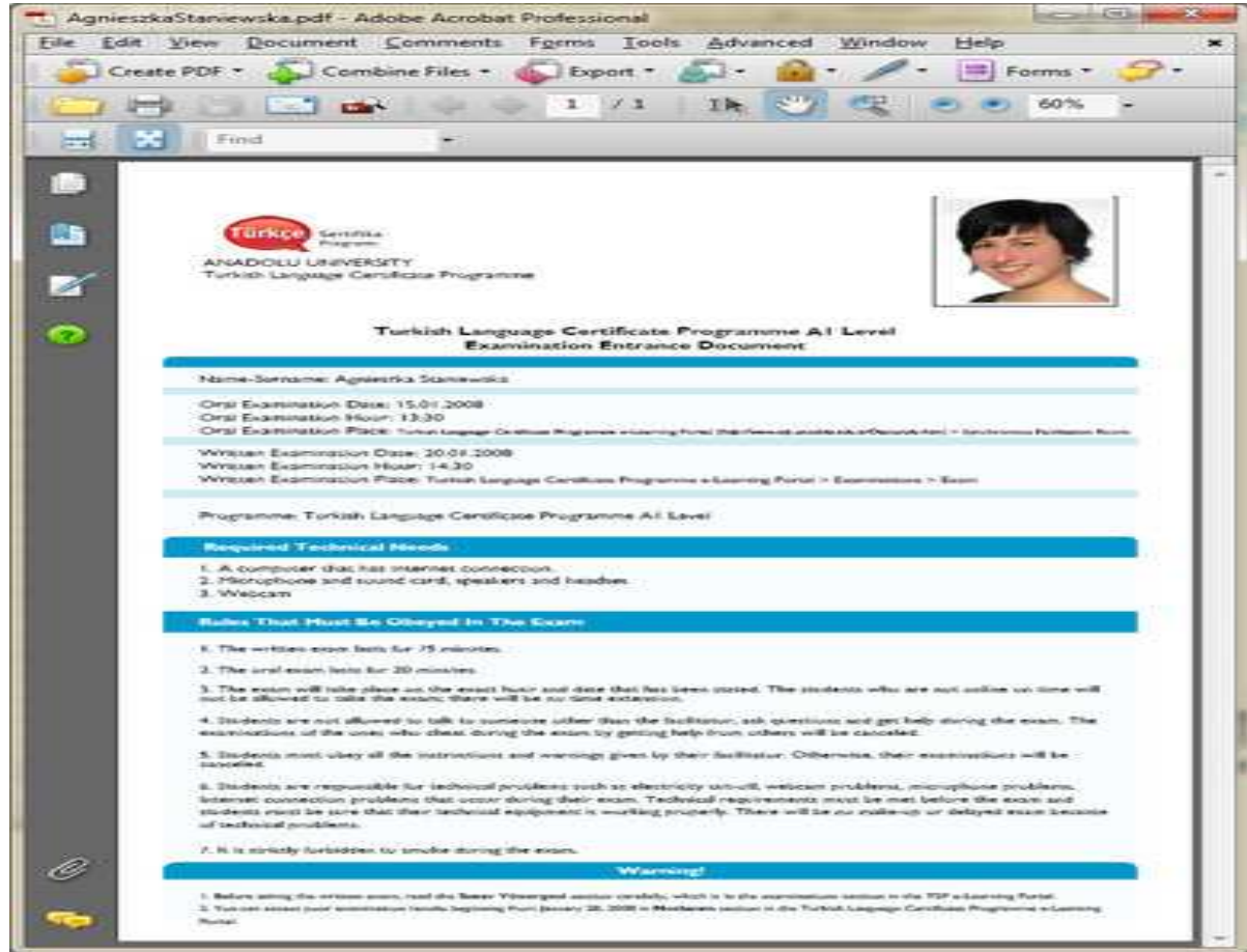
Resim 3: Sınav Giriş Belgesi

Dönem sonunda her öğrenci için bir "Sınav Giriş Belgesi" düzenlenir. Öğrenciye özel hazırlanan bu belgede online sınavın ve sözlü sınavın ne zaman, nerede ve nasıl yapılacağı bilgisi ile sınav yönergesi ve kuralları yer alır. Sınav giriş belgeleri 12 haftalık öğretim döneminin 10. haftasında her öğrenciye e-posta ile gönderilir (Resim 3), web sitelerinde sınav giriş belgelerinin gönderildiğine dair duyurular yayınlanır. Sınav giriş belgesinde yer alan yönergelere ek olarak yine öğrenme yönetim sisteminin Sınav bölümünde Türkçe, İngilizce, Almanca ve Fransızca dillerinde hazırlanan online sınav yönergesi bulunmaktadır.