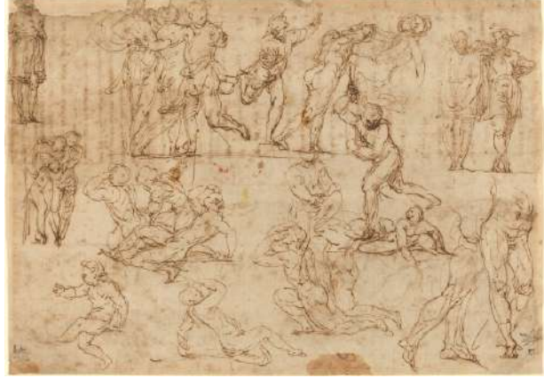
Resim 9: Leonardo Da Vinci's drawings

Bilginin kayıt türlerinin hangisine bakarsak bakalım, kayıt altına aldığımız şeyin düşünülmüş bir fikrin kaydı olduğu unutulmamalıdır. Resim, yazı, video ya da ses kaydı bir düşünme biçiminin kayıdır. Öyleyse desen çizimi de bir şekilde bu kayıtlardan birdir. Herhangi bir şeyin çiziminin yapılması, o şey üzerine düşünmektir. Nitekim desenin de yazının olduğu gibi bir dili ve bir grameri vardır. Gerekli yazım yöntemleri ve gramer bilgisinden yoksun bir sanatçı, doğru bir desen çizemez. Peki, desenin temel elemanlarından biri olan çizginin inandırıcılığı veya gerçekliğin yerini almasının sebebi nedir? Bu sorunun cevabı yine ilkel dönem diye nitelendirdiğimiz tarihsel noktada yatmaktadır. İnsanın düşünme biçimi çevresi ve kendi benliğini kavramasıyla ilintili bir olgudur.