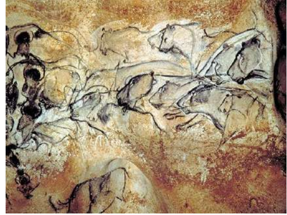
Resim 2: Lions painted in the Chauvet Cave, France

Mağara duvarlarındaki çizimler yaşam deneyimleriyle doğru orantılı bir şekilde ilerlemeye başladıkça bu çizimler giderek soyutlaşmaya sembolleşmeye başlamıştır. İnsanın yazı yazma gerekliliği, Yontma Taş devrinden itibaren başladığını arkeolojik bulgular desteklemektedir. Şüphesiz o çağlarda da iletişim bir ihtiyaç olmuş, bu ihtiyacı da resim ve çizimler karşılamıştır. Nitekim yazının ilk örnekleri de resimlemelerden oluşmaktadır. Bir şeyin miktarını kayıt altına alma ihtiyacını da iplere atılan düğümler ya da yüzeylere çizilen çizgilerle giderilmiştir. Bilgi ve ihtiyaç çoğaldıkça ve üretim arttıkça nesnelere ve soyut düşünceleri anlamlı haline getirmek için şekiller ve semboller üretme ihtiyacı doğmuştur.