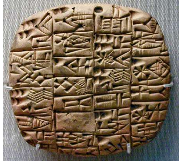
Resim 4: Sumerians Cuneiform Writing

Yazının geliştiği ilk toplumlara baktığımızda başlangıç olarak Orta Asya ve Orta Doğu'da belirmeye başladığı bilinmektedir. Kuşkusuz yazının gelişimi kısa süreli olmamış, insanın ve sanatın gelişimi gibi evrimsel bir süreçten geçmiştir. Nitekim Asya kıtasındaki dilleri ele aldığımızda daha çok sembolik harflerden oluşan bir yazım stili gözlemlenmektedir. Japonya'nın en eski yazım stillerinden biri olan aynı zamanda ideogram olarak