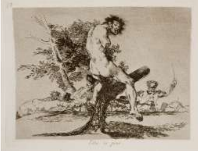
Resim 10: Francis Goya, The Disasters of War

korkunç olayları, açlık, ölüm gibi temaları işlemiştir. Goya'dan günümüze doğru yaklaştıkça aynı tavırla eserler üreten birçok sanatçıya rastlamak mümkündür. Bu sanatçılar arasından Käthe Kollwitz ve Otto Dix'in desenlerinde de görüldüğü üzere 19. yüzyıldan günümüze doğru yaklaştıkça desen çizimleri günlük yaşam, toplumun sosyolojik durumu ve ideolojilerle de ilişki kurmuştur.