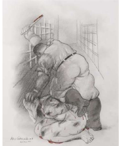
Resim 19: Fernando Botero, Abu Gharib