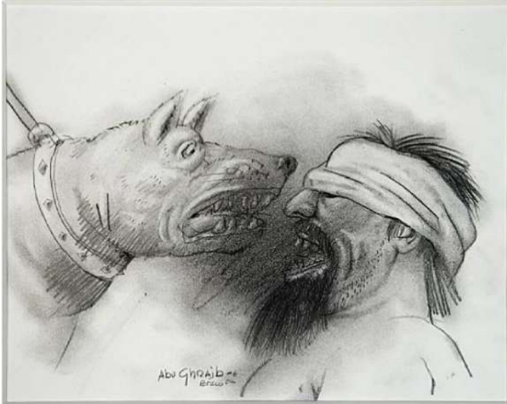
Resim 18: Fernando Botero, Abu Gharib

Fernando Botero ise 2003 yılında Irak'ta yaşanan işkence olaylarının fotoğraflarını yeniden ele alarak desenler çizmiştir. Sanatçı kendi düşünme biçimi ile olayları gözlemlemiş, fotoğraflardan kendi biçimini oluşturmuştur. Böylelikle fotoğrafın durağan görüntüsü, içerikle biçimin birbirine bağlandığı zihinsel bir süzgeçten geçerek yeniden inşa edilmiştir.