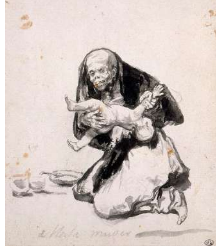
Resim 11: Francis Goya, Wicked woman