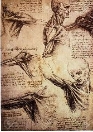
Resim 8: Leonardo Da Vinci's drawings

Rönesans dönemine gelene kadar, resim sanatında bir gerileme yaşandığı açıkça görülmektedir. Gotik dönemde ortaya çıkan eserlerde hacim ve formlar adeta mağara döneminde yapılan eserlerden bile geridedir. Bilginin sınırları ortadan kalktığı, Avrupa’da yeniden doğan bu düşünme biçimi adeta sanatı uzun sürmüş bir kış uykusundan uyandırmıştır. Leonardo Da Vinci’nin bilimsel çalışmalarında kullandığı çizimler günümüz tıp eğitiminde bile ilk başlangıç derslerinin kitaplarını bezemektedir.