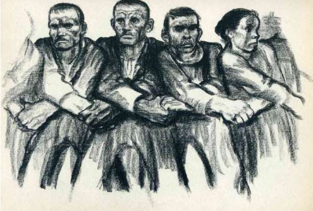
Resim 12: Käthe Kollwitz, Solidarity