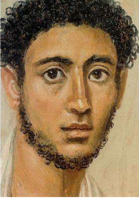
Resim 5: Fayyum Portrait 1

da tanımlanan Kanji 1 , Kore yoluyla Çin'den Japonya'ya gelmiştir. Kanji, aynı zamanda yaklaşık iki bin yıllık bilinç birikimin sembolleşmiş halidir. Bu karakterlerin ortaya çıkışı, Mısır Hiyerogliflerinin Sümer yazı sistemine kaynaklık etmesi gibi yüzeylere çizilen resimlerden gelir. Çeşitli objeleri, durumları ve soyut fikirleri karşılayan bu basit resim ve şekillerden ortaya çıkan Kanji, yüzyıllar içerisinde değişerek tamamen soyut birer kavram niteliği kazanmış günümüzdeki haline ulaşmıştır.