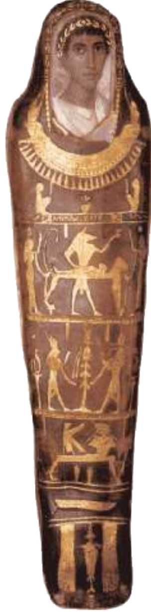
Resim 7: Fayyum Portrait 3