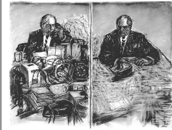
Resim 16: William Kentridge, Soho