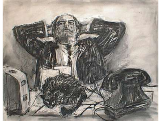
Resim 17: William Kentridge, Soho

Günümüze en yakın desen örneklerine baktığımızda William Kentridge ve Fernando Botero göze çarpmaktadır. Kentridge, Güney Afrika'da uzun süre devam etmiş olan Apartheid dönemini ele alarak desenlerini üretirken yalnızca çizim yapmamış, aynı zamanda bu geleneksel çizim yapma tavrını kameraya alarak başka türlü bir bellek oluşturma biçimi yaratmıştır. Yaptığı her hareketin fotoğrafını çeken sanatçı, "stop motion" 2 tekniğini kullanarak çizim-animasyon biçiminde birçok eser ortaya koymuştur.