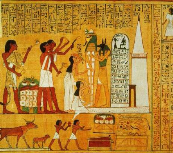
Resim 3: Egyptian Ancient Egypt Art

Mağara duvarlarındaki çizimler yaşam deneyimleriyle doğru orantılı bir şekilde ilerlemeye başladıkça bu çizimler giderek soyutlaşmaya sembolleşmeye başlamıştır. İnsanın yazı yazma gerekliliği, Yontma Taş devrinden itibaren başladığını arkeolojik bulgular desteklemektedir. Şüphesiz o çağlarda da iletişim bir ihtiyaç olmuş, bu ihtiyacı da resim ve çizimler karşılamıştır. Nitekim yazının ilk örnekleri de resimlemelerden oluşmaktadır. Bir şeyin miktarını kayıt altına alma ihtiyacını da iplere atılan düğümler ya da yüzeylere çizilen çizgilerle giderilmiştir. Bilgi ve ihtiyaç çoğaldıkça ve üretim arttıkça nesnelere ve soyut düşünceleri anlamlı haline getirmek için şekiller ve semboller üretme ihtiyacı doğmuştur.