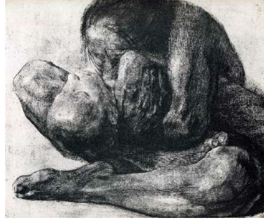
Resim 13: Käthe Kollwitz, Woman with Dead Child