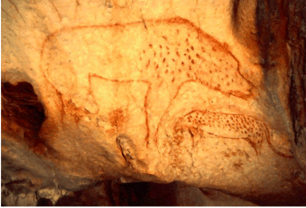
Resim 1: Hyena painting in the Chauvet Cave, France

çizimlerin ilk örnekleridir. Sonraları daha sert taş çeşitleriyle kazıma suretiyle yapılan çizimler insanlık tarihine ilk derin izlerini bırakmaya başlamış, resim tarihinin ilk örneklerini oluşturmuştur. Renk veren çeşitli mineralleri topraktan elde edilen renkleri ve kömürü kullanmaya başlayan insan daha karmaşık figürler boyamaya başlamıştır. Avrupa'da kırmızı renk için demir oksit (hematit) kullanıldığı bilinmektedir. Siyah renk için mangan dioksit ve odun kömürü, beyaz için ise kaolin kullanılmıştır.