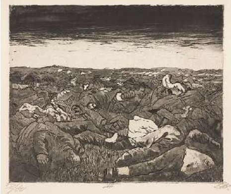
Resim 14: Otto Dix, Evening on the Wijtschaete Plain