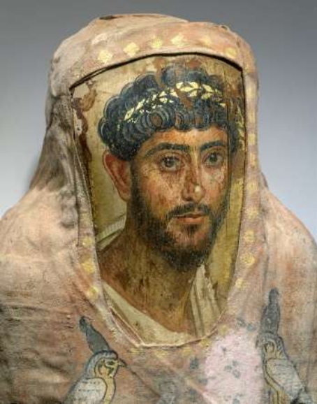
Resim 6: Fayyum Portrait 2