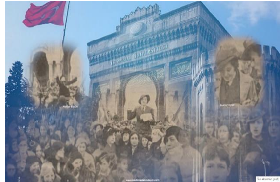
Şekil 6. 1934 Beyazıt Mitinginden Kolaj Sahne