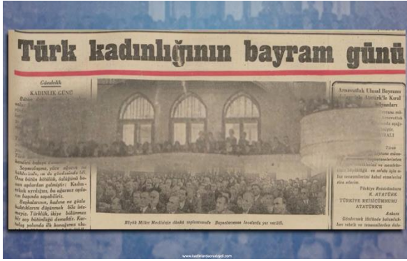
Şekil 5. Kadınlar Meclis Locasında