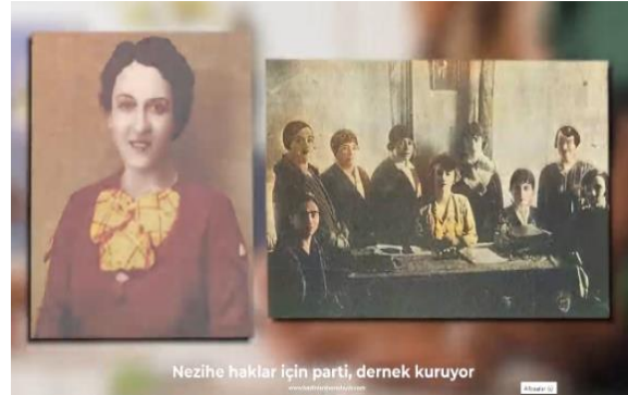
Şekil 10. Nezihe Muhiddin ve Kadınlar Birliği Üyeleri