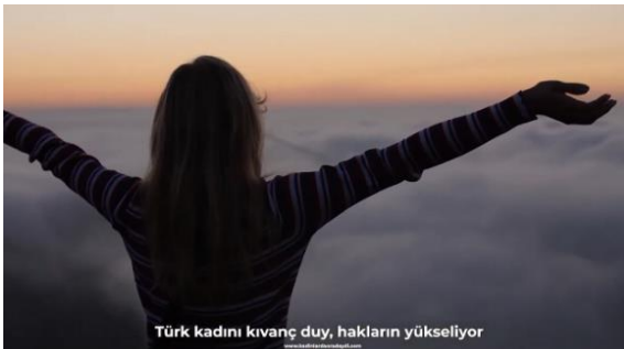
Şekil 10. Hakları yükselen Türk Kadını (Temsili)