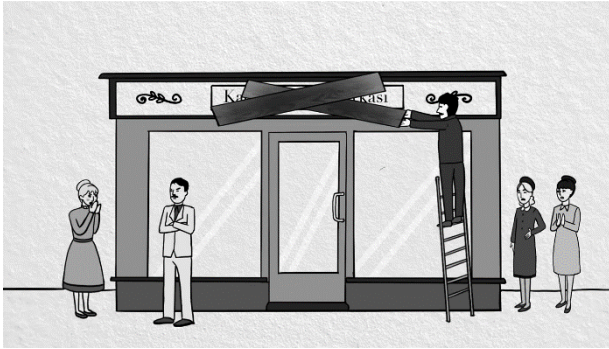
Şekil 1. Kadınlar Halk Fırkasının Engellenmesi