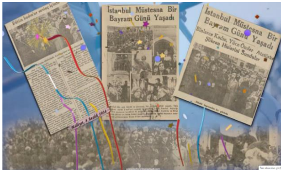
Şekil 7. 1934 Mitingi Gazete Haberleri