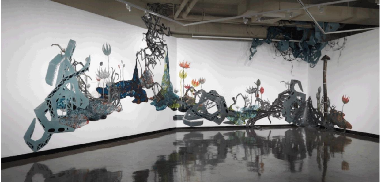
Resim 2: Yarı-Yaşam, N. López, 2007.

Üzerine Notlar adlı yazısında Gyorgy Kepes'in "Görsel alanda, özellikle de çevremizden algıladığımız art arda imajlarla, imajların yan yana getirilmesi, en güçlü sembolik nitelikleri ortaya çıkartır " (Kepes, 1996: 178) ifadesi kent, mimari, haritalar ve antropoloji alanında arařtırmalar yapan López'in enstalasyonunda kullandığı form tekrarlarının sadece biçimsel bütünlük veya ritim ile ilgili olmadığının göstergesi niteliğindedir.