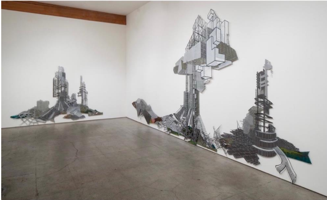
Resim 5: Çorak Topraklar Garip Hayaller Doğurur, N. López, 2014 ( https://www.nicolalopez.com/selected-installation#/barren-lands/ )

Kitlesele gözetim ve veri toplama üzerine çalışmaları olan Amerikalı sanatçı, coğrafyacı ve yazar Trevor Paglen, 2007 yılında Bomb Magazin'de yer alan yazısında, López'in enstalasyonlarının, çağımız insan faaliyetlerinin, gezegenimizdeki baskın jeolojik güç olduğunu yansıttığına dikkat çekmektedir. Doğaya karşı sorumluluk almamız ve López'in işlerini de bu açıdan okumamız gerektiğine vurgu yapmaktadır. "Aslında, López'in gösterdiği gibi, "doğal afet" diye bir şey olamaz, çünkü afet kavramının kendisi umutsuzca insan merkezidir" ( https://bombmagazine.org/articles/2007/07/01/nicola-l%C3%B3pez/ ).