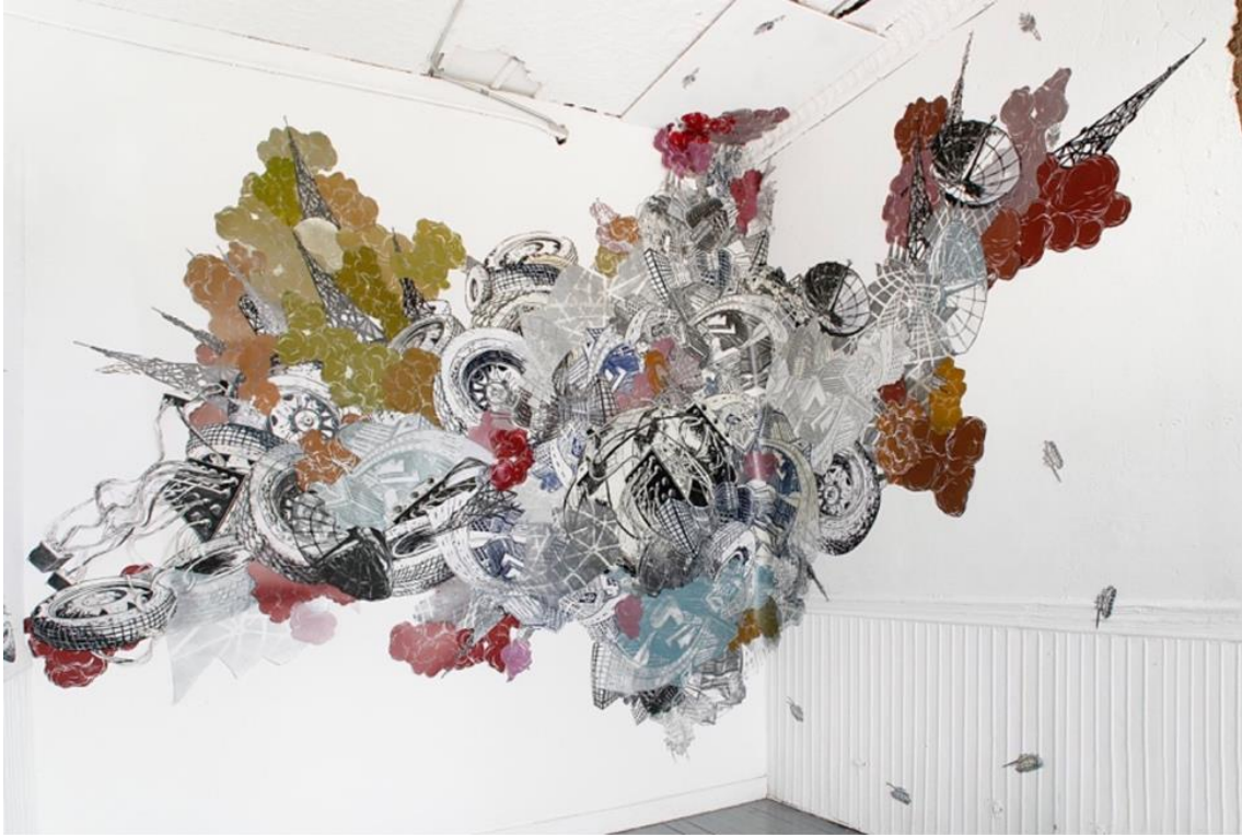
Resim 1: Umut Veren Bir Yarın, N. López, 2004.

önceki görüntülerde kıtalar ve kentsel kümeler gibi şekilleri seçebiliyordunuz ve yavaş yavaş binalar, sokaklar, uydu antenleri ve diğer bireysel nesnelere gibi bireysel formlar görünür hale geldi ve sonunda her binanın altyapısını (çelik kirişler, su tesisatı, elektrik kabloları vb.) görebileceğiniz yere yakınlaştırıldı. Ayrıca New York'ta bulunmamın ve diğer şehirlerde zaman geçirmemin, ki bunlar çok sayıda yapı ve tarih katmanına sahip sıkıştırılmış, yoğun alanlardır, kentsel çevreye olan hayranlığımla çok ilgisi olduğunu düşünüyorum" ( https://brooklynrail.org/2009/06/art/nicola-lpez-with-phong-bui/ ).