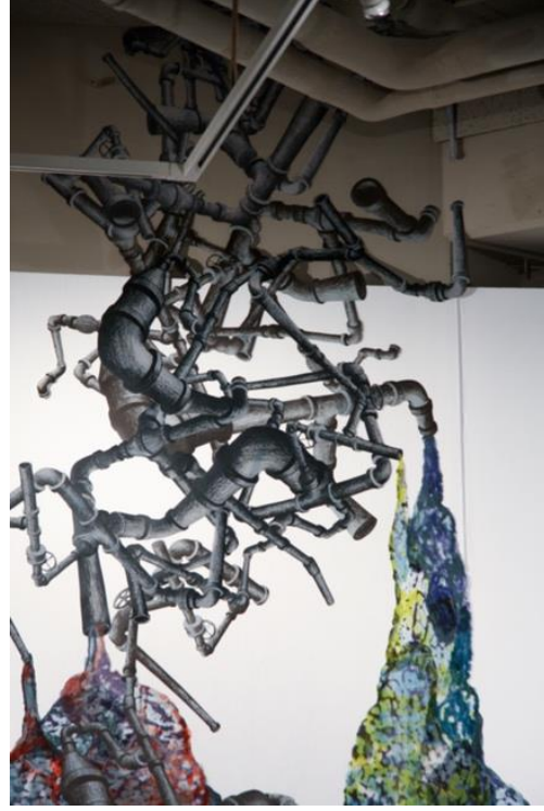
Resim 3: Yarı-Yaşam (detay), N. López, 2007. ( https://www.nicolalopez.com/selected-installation#/half-life/ )