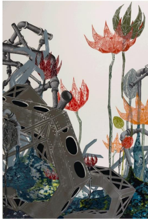
Resim 4: Yarı-Yaşam (detay), N. López, 2007. ( https://www.nicolalopez.com/selected-installation#/half-life/ )