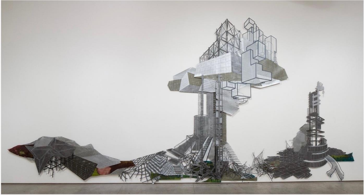
Resim 7: Çorak Topraklar Garip Hayaller Doğurur(detay), N. López, 2014 ( https://www.nicolalopez.com/selected-installation#/barren-lands/ )

Çorak Topraklar Garip Hayaller Doğurur, 3,048 metre yüksekliğinde ve 8,8392 metre uzunluğunda polyester üzerine ağaç baskı, monotip ve serigrafi baskı kolajları ile galerinin iki duvarını kapsamaktadır. Baskı malzemesi olarak yarı saydam ve esneklik özelliği olan polyesteri tercih etmesini, hem endüstriyel yapaylığı yine endüstriyel bir malzemeyle temsil etmesi, hem de üst üste gelen baskılar ve kolajlarla altta kalan yapı elemanlarının okunurluğunu engellememesi açısından değerlendirmemiz mümkündür. İnsan, doğa ve doğaldan uzak, her an yıkılacak etkisi veren distopik peyzajları, teknolojinin insan kontrolünden çıkması kaygılarını yansıtmaktadır. Çağımız sorunlarının başında gelen doğa katliamı ve bunun sonuçlarından sadece biri olan iklim felaketini konu alan eser büyük ölçeği ile izleyicileri gelecekle ilgili sorgulamaya yöneltmekte etkili bir görev üstlenmektedir.